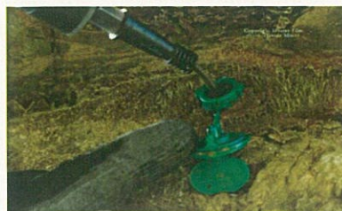
Fig. 12. Trattamento in cannula

L'operatore deve comunque usare le precauzioni essenziali nello svolgimento del trattamento quali guanti in gomma e maschera protettiva. Il trattamento va ripetuto ogni 20-40 giorni nel periodo che va da febbraio a novembre, in cui è stata riscontrata l'attività dell'insetto.