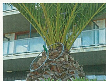
Fig. 7. Docciatura permanente in PCV

In alternativa possono essere installate delle docce permanenti a cui periodicamente tramite una pompa irroratrice da giardino diamo il prodotto con la frequenza sopra indicata.