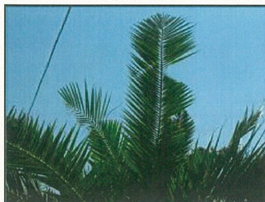
Fig. 3 Margini seghettati e rosure fogliari

Successivamente si ha un gradiente di danno sempre più intenso con la cima che si piega e la chioma che si appiattisce. La pianta, da un'osservazione a distanza, appare come appiattita.