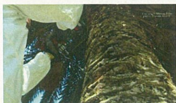
Fig. 8. Perforazione fusto