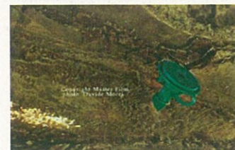
Fig. 10. sigillatura cannula