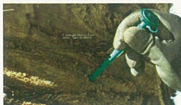
Fig. 9. Installazione cannula