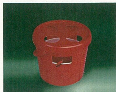
Fig. 6. Trappola a ferormoni