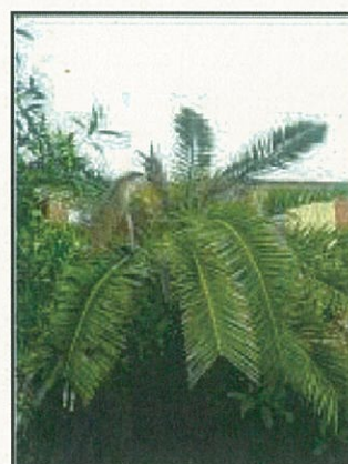
Fig. 4 Asimmetria della chioma e appiattimento

L'esito finale dell'infestazione di Rhynchophorus ferrugineus sui vegetali di palma è la morte della pianta, la cui chioma presenta tutte le foglie secche e ripiegate verso il basso, in una tipica forma ad ombrello.